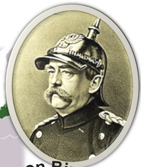
Otto von Bismarck = železný kancléř