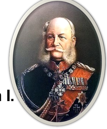
císař Vilém I.