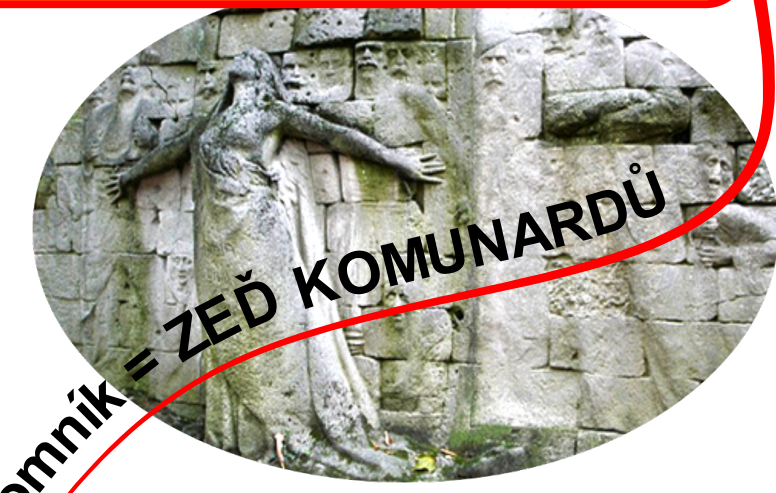
pomník = ZEĎ KOMUNARDŮ